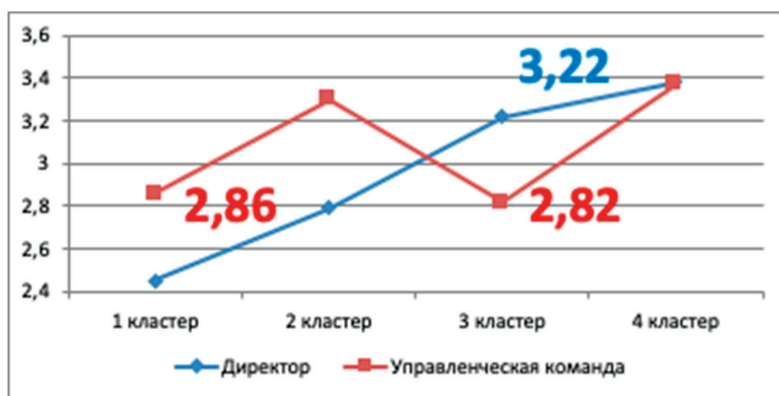
Рис. 6. Показатели средних значений лидерского потенциала руководителей школ и их команд по кластерам

Значительная часть руководителей третьего кластера ориентирована на обеспечение качественной работы школы за счет формирования ответственности сотрудников за свою деятельность: 56% – очень часто принимали меры для того, чтобы учителя чувствовали ответственность за образовательные результаты учащихся, 32% – очень часто способствовали тому, чтобы учителя чувствовали ответственность за улучшение навыков преподавания. Четверть директоров подкрепляют важность саморазвития собственным примером.