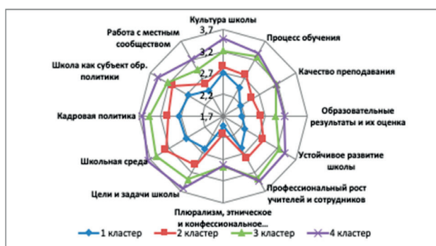
Рис. 3. Показатели средних значений лидерского потенциала руководителей школ по кластерам

3. Менеджерские (вопросы, решение которых создает условия для образовательного процесса) (блоки 4-6, 10-12): «Плюрализм, этническое и конфессиональное многообразие», «Цели и задачи школы», «Школьная среда (позитивный, творческий климат)», «Кадровая политика». «Школа как субъект образовательной политики», «Работа с местным сообществом».