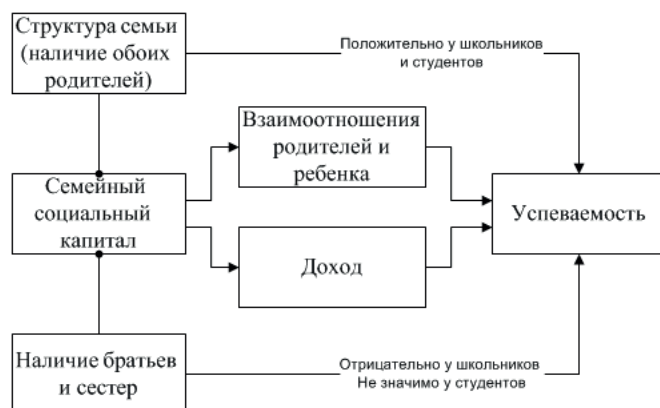
Рисунок 2. Механизмы влияния семейного социального капитала на успеваемость детей

Таким образом, для успеваемости студентов университета, так же как и для школьников, значимым является наличие обоих родителей и проживание в полной семье, в то время как фактор наличия братьев и сестер не подтверждает свою значимость.