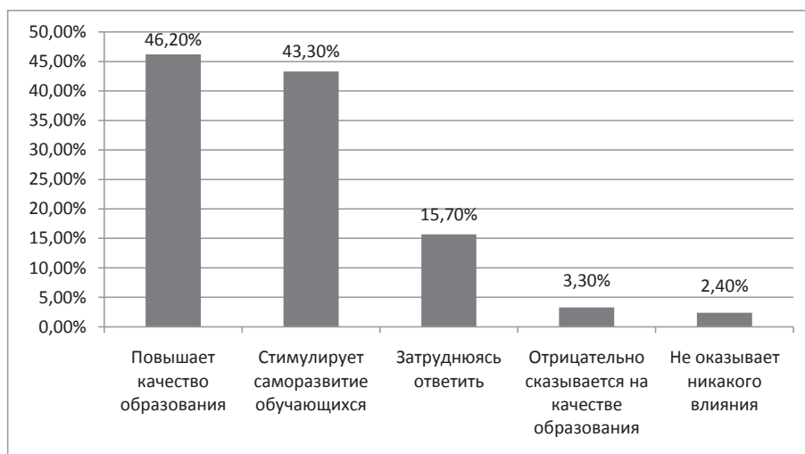
Рис. 1. Как репетиторство влияет на качество образования?

В положительном влиянии репетиторских занятий на качество образования уверены 89,5 % опрошенных; 43,3 % педагогов согласились, что репетиторство стимулирует саморазвитие обучающихся. Педагоги сельских школ выражают положительное отношение к практике частных вспомогательных занятий, в том числе и применительно к своим детям. У 195 опрошенных специалистов есть дети, из них 69 (35 %) указали, что их дети прибегали к услугам репетиторов. На вопрос: «Пользуются ли Ваши ученики услугами репетиторов?» – 75 педагогов дали положительный ответ. Таким образом, выявлено, что у 35 % сельских учителей обучающиеся занимаются с частными педагогами. Для сравнения отметим, что в городах занимаются с репетиторами 68 % старшекласников (Burdyak, 2015).